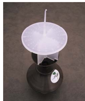
Trampa Yatorf para Agriotes lineatus

Colocar el cesto en la tapa de la trampa Unitrap y encajar roscando el contenedor en la parte inferior del cuerpo principal de la trampa.