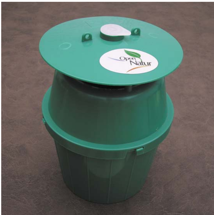
Trampa Unitrap para Agriotes lineatus

Colocar en el cesto el dispensador sin abrirlo y cerrarlo.