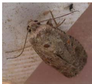
Adulto de Spodoptera exigua

Adultos: posee una envergadura alar de 2,5 a 3 cm. Las alas anteriores son de color marrón terroso a gris. Tienen dos manchas: orbicular y renal de colores anaranjados características, que destacan del resto. Las alas posteriores son blancas con nervaduras más oscuras y el borde de las mismas es de color marrón negruzco difuso.