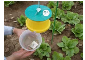
Capturas de Spodoptera exigua

Las Soluciones Agrobiológicas de Opennatur