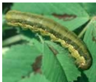
Larva de Spodoptera exigua

Huevos: se encuentran normalmente depositados en pequeños grupos (10-250 huevos), recubiertos de escamas blancas, denominados plastones. De forma individual, cada huevo presenta una coloración que va del blanco al marrón- amarillento recién puestos, y marrón oscuro antes de su eclosión. Presentan también estrías verticales y una forma similar a la de una cúpula. El tamaño medio oscila de 0,35 a 0,37 mm.