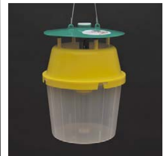
Colocar la feromona en el cesto y cerrarlo.